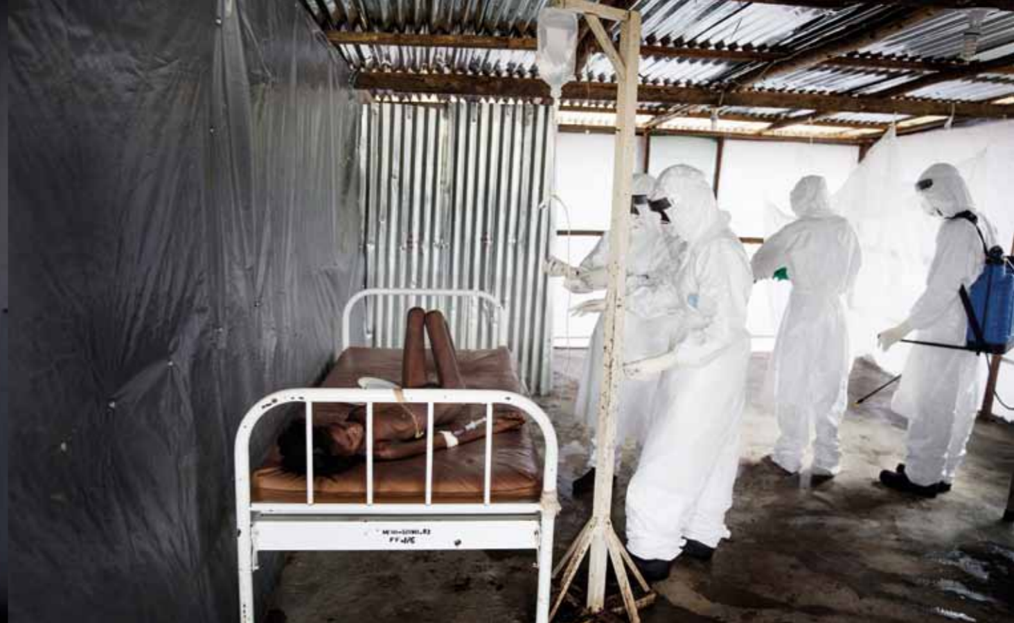
respons från Läkarmissionens givare kunde sjukhuset köpa in skyddsmaterial.