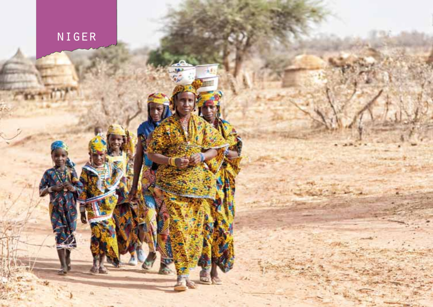
Fulani är ett herdefolk som är spritt över hela Västafrika. Kvinnorna känns igen på sina gulsprakande dräkter.

» DET LIGGER FESTSTÄMNING i luften när vi kommer till byn Pogodji i södra Niger i Västafrika. Vi tas emot med sång och handklappning. Det känns högtidligt och det råder inget tvivel om att detta är en upplevelse som kan inordnas i kategorin ”once in a lifetime” – en gång i livet, knappast mer.