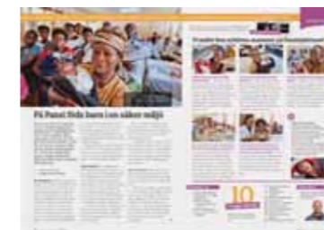
Svenska Journalen juni 2015.