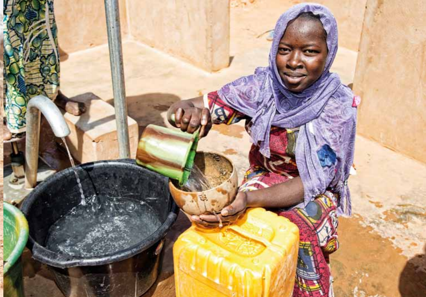
Vattensituationen håller på att förbättras på många platser i södra Niger tack ett stort utvecklingsprogram som flera organisationer står bakom.

MEST OMTALAT PÅ senare år har Niger blivit för att vara transitland för de många människor som via Libyen försöker ta sig till Europa. I en förtvivlad förhoppning om ett annat liv sitter de packade på lastbilsflak i veckor genom öknen. För många slutar färden innan de ens når Libyen. De dör av törst eller sjukdom, eller blir ihjälslagna när någon vill komma åt pengarna de