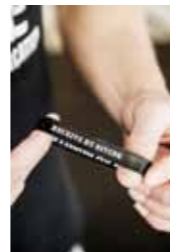
Med varje tröja de säljer följer det med armband tryckta med loggan Strong as Life på utsidan och Recieve by giving på insidan.