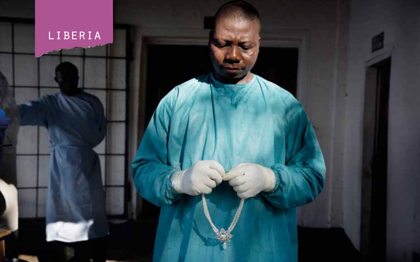
Fem anställda på Foya- Borma-sjukhuset dog i ebola. Francis hade inte ens plasthandskar att erbjuda personalen, men tack vare en snabb