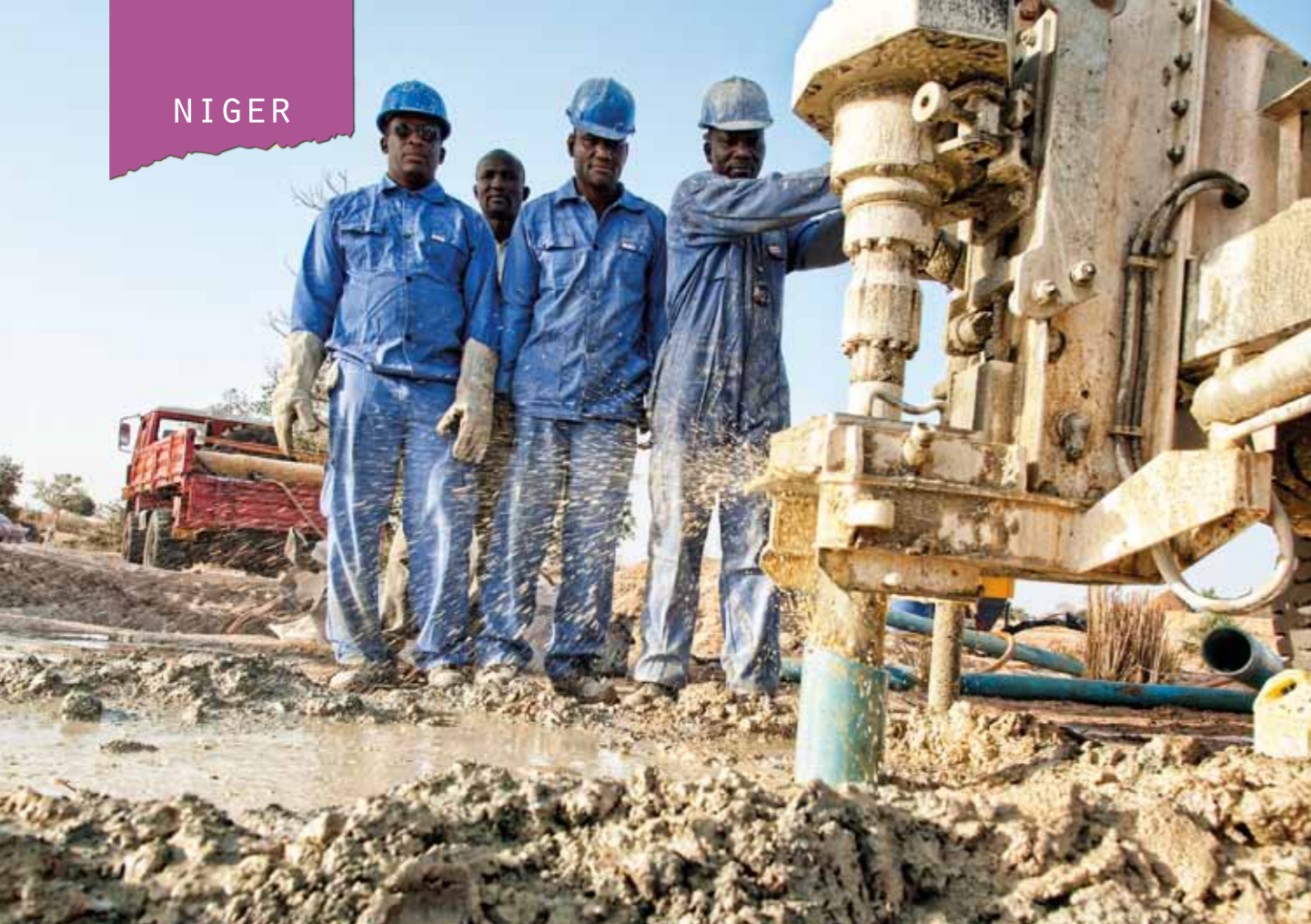
Vattnet i södra Niger ligger på cirka hundra meters djup. Skickliga och rutinerade borrarare från organisationen International Aid Services (IAS) ser till att ett stort antal byar får rent och friskt vatten.

månad tillbaka en borrarad och fullt iordningställd brunn. Den är välgjord på alla sätt, med cementerade väggar och en pumpanordning av så kallad fransk modell – vilket betyder att man använder fötterna för att få upp vattnet.